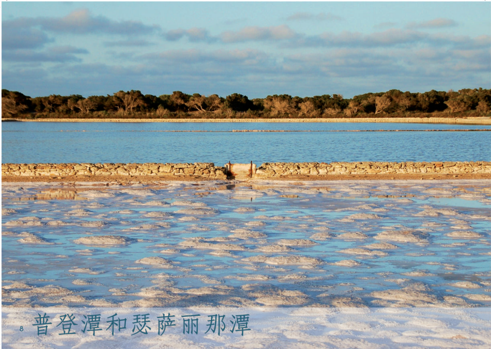
8 普登潭和瑟萨丽那潭