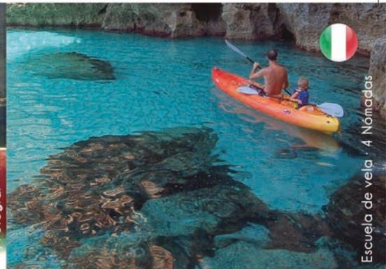
Escuela de vela / 4 Nomadas