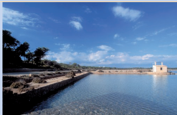
Salines Marroig de Formentera.

Ses Salines d'Eivissa i Formentera constituyen un ejemplo paradigmático de la riqueza de la biodiversidad mediterránea. Su singularidad se basa en proporcionar un lugar de descanso y nidificación para la fauna ornítica en sus migraciones. Como espacio natural de especial interés engloba un conjunto de hábitats terrestres y marinos, con valores ecológicos, paisajísticos, históricos y culturales de primer orden a escala internacional.