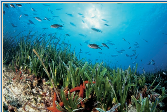
Praderas de Posidonia oceanica.