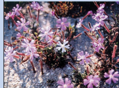
"Molinet" ( Silene cambessedesii ), an endemic carnation

El ámbito terrestre del parque natural acoge una magnífica representación de la mayoría de formaciones vegetales existentes en las islas Pitiusas, con unas 178 especies de plantas. Aparecen representados los pinares mediterráneos, los sabinars costeros, los salicorniars y la vegetación halófila que rodea las lagunas, así como los sistemas dunares y la vegetación litoral de los acantilados.