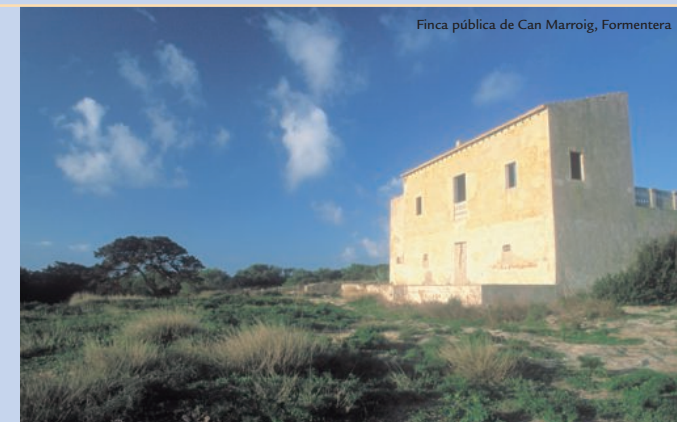
Finca pública de Can Marroig, Formentera

Can Marroig es una propiedad rural muy interesante desde el punto de vista histórico. Incluye la Torre de Punta Gavina, la casa principal de estilo mallorquín y los corrales, actualmente rehabilitados para alojar el Centro de Información y Educación Ambiental del Vírot.